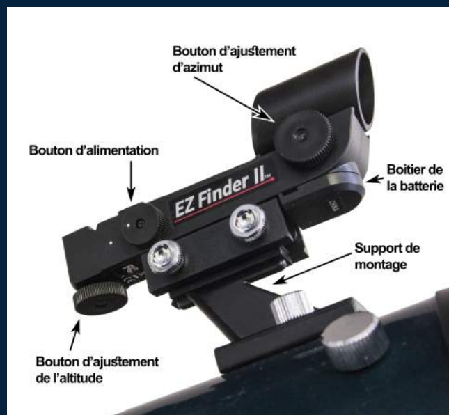
Figure 5 - Détail du viseur « EZ Finder »